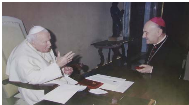
A colloquio con Giovanni Paolo II