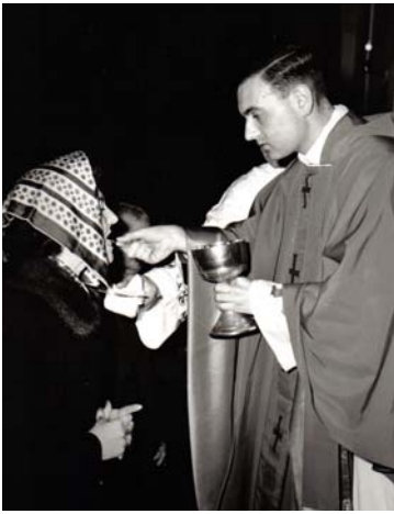
Celebrazione prima Messa

condizione di dire: ho solo chiesto al Signore di fare la sua volontà. Attenti! Questa affermazione non vale solo per chi è chiamato alla vita consacrata, ma vale per tutti, perché tutti siamo chiamati a fare nel nostro lavoro la volontà di Dio. Non è facile, ma le gratificazioni più godute stanno proprio nel vincere il difficile e vincerlo senza l'aiuto del "solito", sempre pronto a ricordarti...."Ma se non era per me!" Quanto è meglio dire: "Grazie Signore".