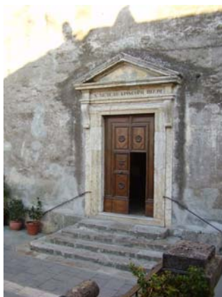
La nostra Chiesa