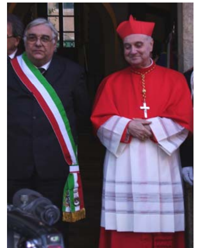
Il Cardinale in visita al suo paese

Il tempo della sua crescita spirituale inizia nella corsia di un ospedale insieme ad altri sofferenti, dopo un doloroso e difficile intervento al cuore. Mi diceva che i suoi compagni di corsia si meravigliavano della sua serenità nel sopportare la sofferenza e come si facesse partecipe della sofferenza altrui. Tanto che un suo vicino di letto un giorno gli chiese: "Ma non sarai mica un prete!". "Se ti può far piacere posso dirti