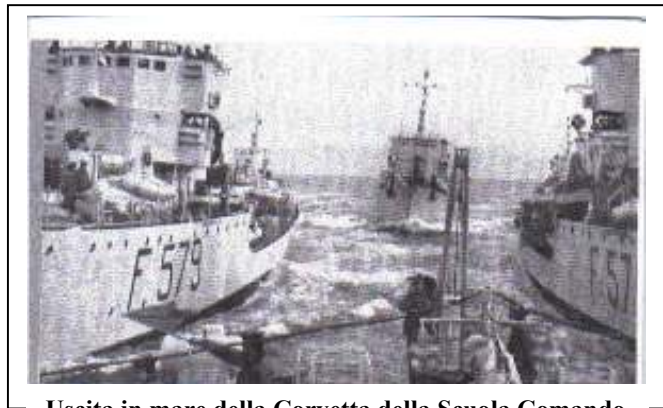
Uscita in mare della Corvetta della Scuola Comando

Le uscite in mare duravano 15 giorni, poi allestivamo la nave per approntarla ad intraprendere la crociera chiamata di addestramento.