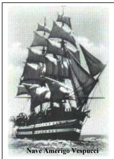
Nave Amerigo Vesputti

Negli anni 1957-58 ho effettuato diverse crociere toccando quasi tutti i porti italiani ed all'estero (Spagna, Francia e Grecia), quando ancora gli italiani non potevano andare in villeggiatura.