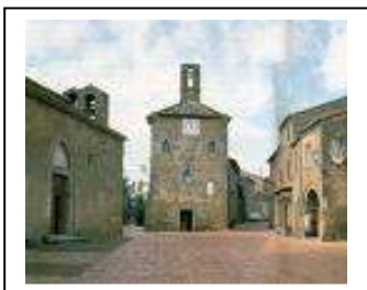
La Piazzetta di Sovana

Gli anni passano veloci, ora ho quasi 69 anni, il tempo trascorre anche piacevolmente. Con le famiglie di altri cinque colleghi, abbiamo creato una sincera amicizia e comitiva. In estate andiamo tutti insieme al mare e durante l'anno non mancano gite o serate in pizzeria. Ultimamente sono tornato al mio Paese ed ho salutato molte persone che a prima vista stentavo a riconoscere. Adesso il Paese è ammodernato, vi abitano famiglie straniere, vi