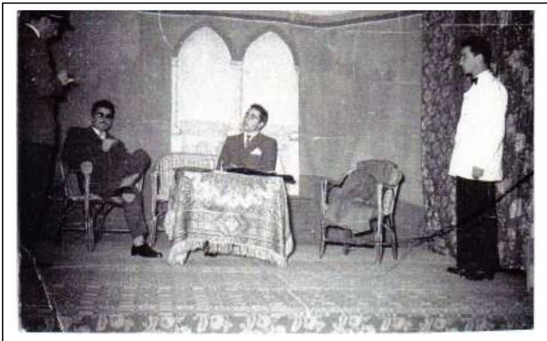
Recita teatrale asilo Piccolomini – Natale 1956

Al termine di un anno, il corso finì, ero risultato idoneo e quindi tornai dai miei per godere di una meritata licenza di 15 giorni. In tasca però avevo il biglietto per il treno che al