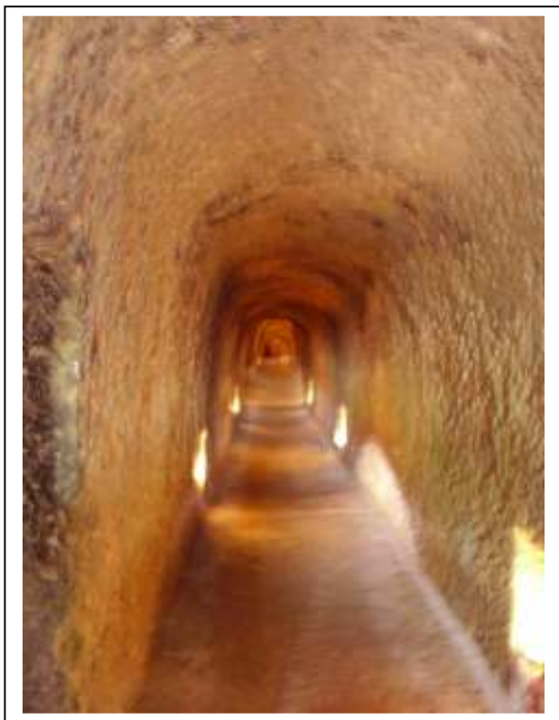
Camminamenti sotterranei della fortezza Orsini (un tempo dette mine)

L'Ente per il Turismo ha organizzato il giro delle "mine" (un percorso nei sotterranei della Fortezza) con guida, illuminazione e pagamento di euro.