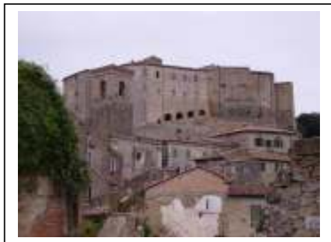
Sorano – La Fortezza Orsini vista dal basso

stanze ed alle pareti sono appesi quadri raffiguranti Sorano dei miei tempi.