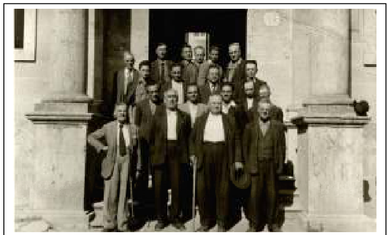
Gli scampati alla fucilazione