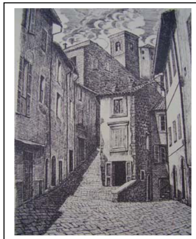
disegno di G. PELLEGRINI