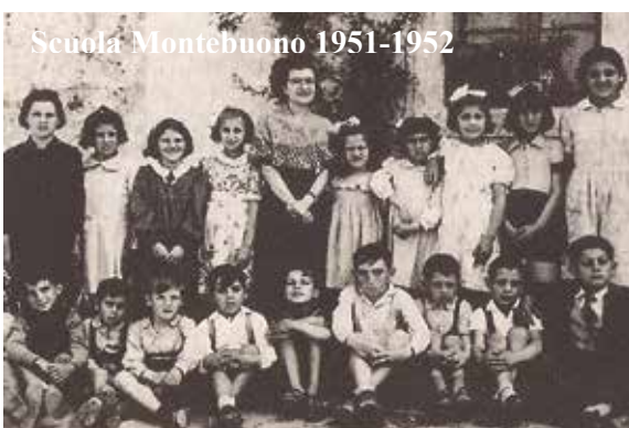
Scuola Montebuono 1951-1952